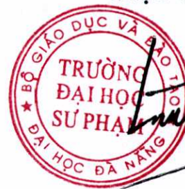
PGS.TS. LƯU TRANG